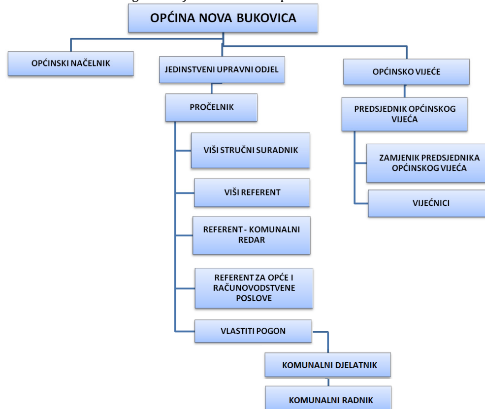
Slika 1. Organizacijska struktura Općine Nova Bukovica